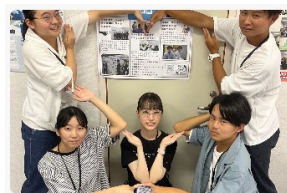
長崎大学総合診療ぶらいまりけあサークル そぶら