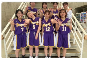
医学部女子バスケットボール部

10月11日から20日に開催されたオンラインチャリティーイベント「 Giving Campaign2024 」に今年度初めて参加しました。Giving Campaignとは、皆様の投票が長大生への支援（寄附）に繋がる、“ 学生が主役の ”資金調達イベントです。参加者は特設サイトから投票するだけでなく、応援メッセージを送ったり、学生団体に直接寄附を行うことができます。本学からは、22の学生団体がSNS等を利用して応援を呼びかけました。 10日間という短い期間にも関わらず、延べ4,414人からの応援を受け、寄附金額は、901,000円となりました。 多くの応援メッセージを頂戴し、本学の学生団体、大学としても励みとなりました。温かいご支援、誠にありがとうございました。